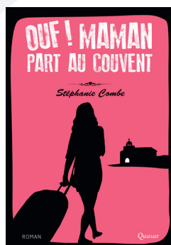
Ouf ! Maman part au couvent